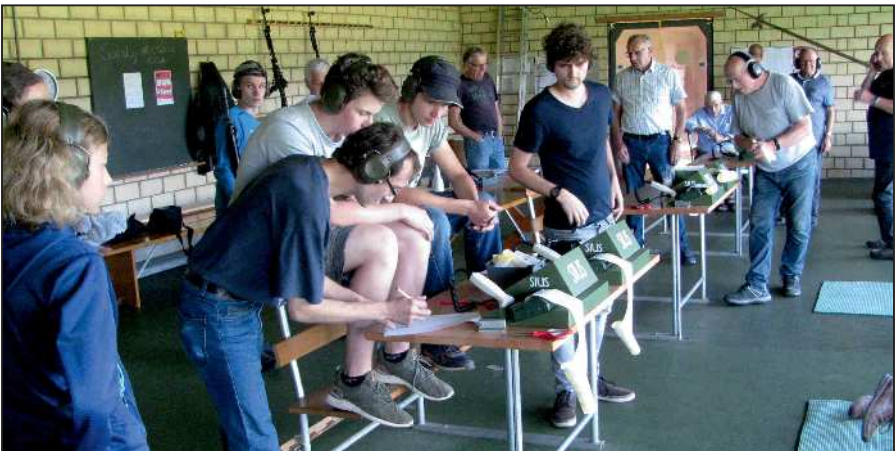
Im rückwärtigen Raum der Schützenlinie herrscht geschäftiges Treiben