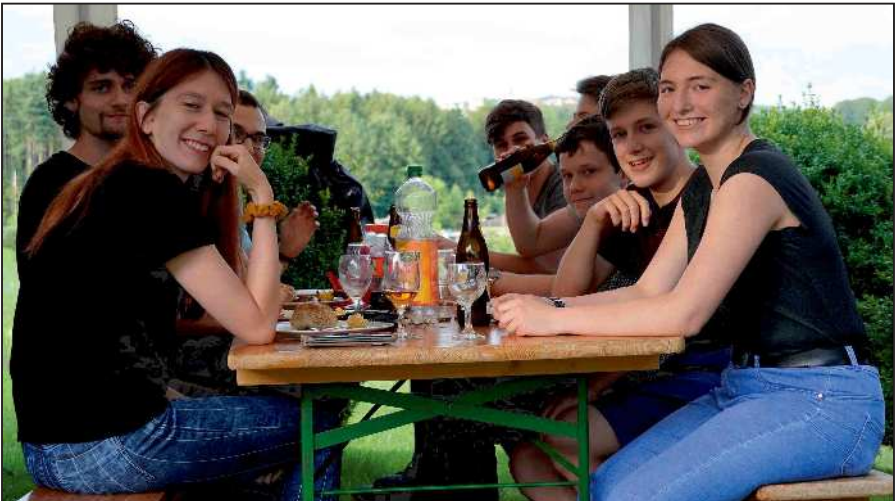
Die junge Generation war am Absenden des Kilbischessens zahlreich vertreten und pflegte die Schützenkameradschaft