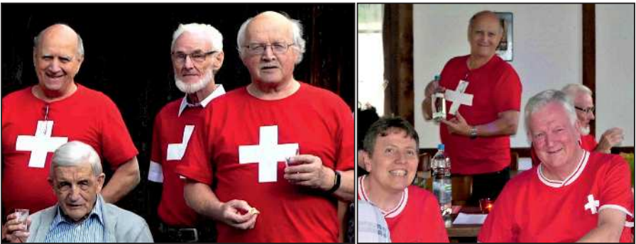
Trotz Corona herrscht an der 1. Augustfeier 2021 eine gemütliche Stimmung