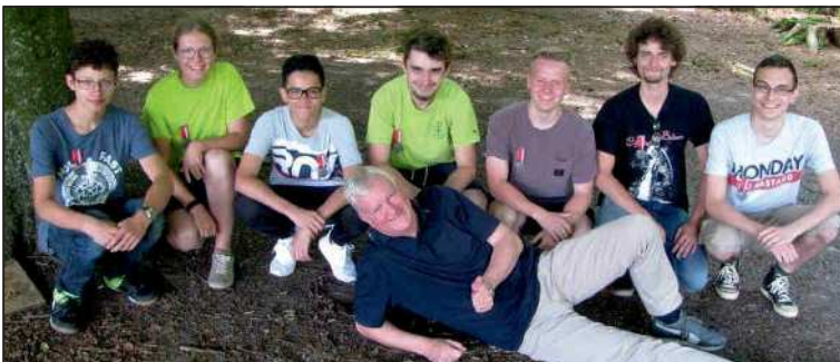
Jungschützen und Leiter am Wettschiessen in Emmen