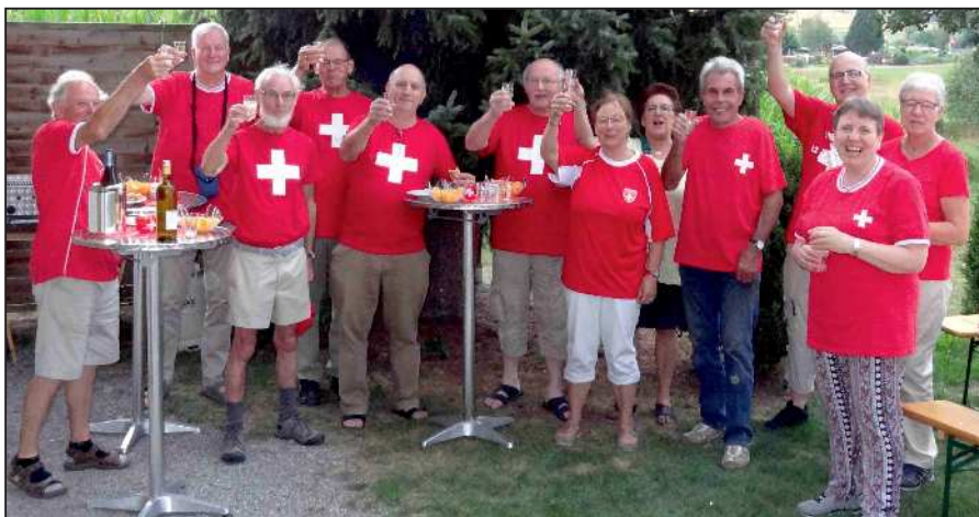
Gruppenbild anlässlich der 1. Augustfeier 2018