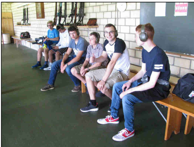
Die Jungschützen warten auf ihren Einsatz am Feldschieszen.