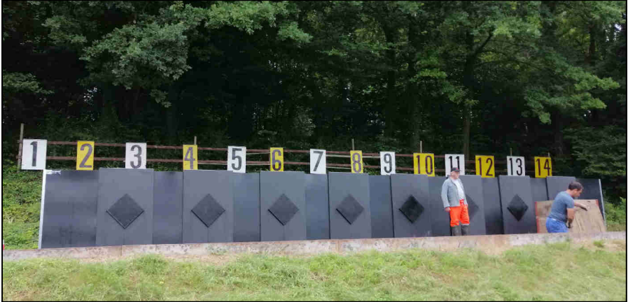
Montage der Kugelfänger