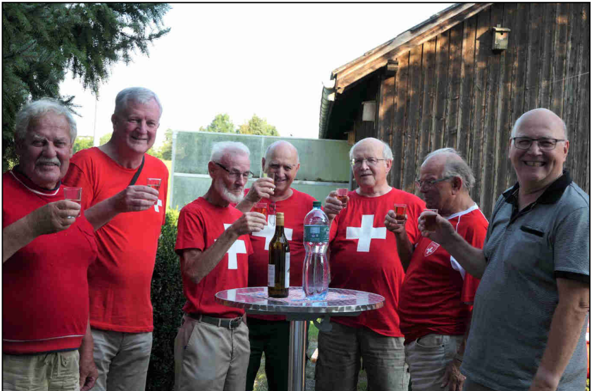
Gemütliche Stimmung an der traditionellen 1. Augustfeier des Wehrvereins Hochdorf