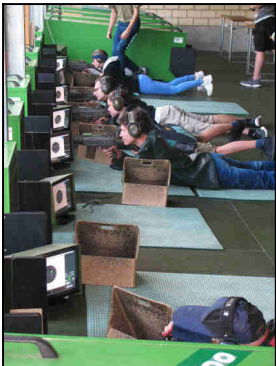
Die neue Sius-Trefferanzeige funktioniert reibungslos