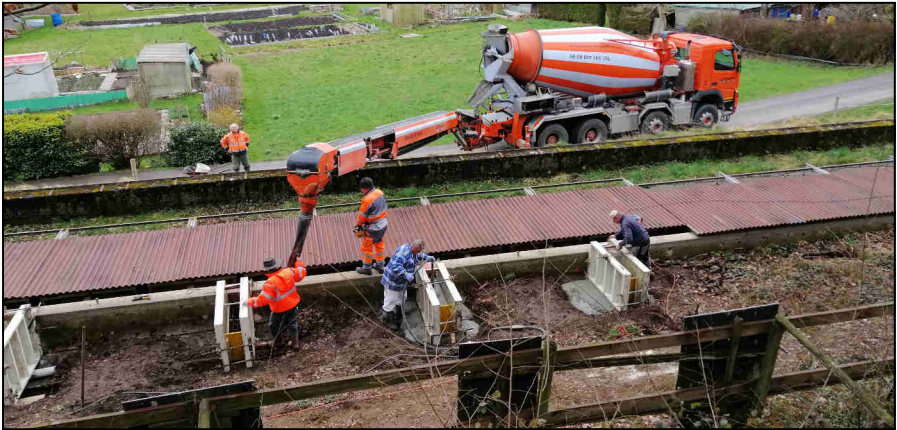
Kugelfangererneuerung im Scheibenstand, hier wird das Fundament erstellt.