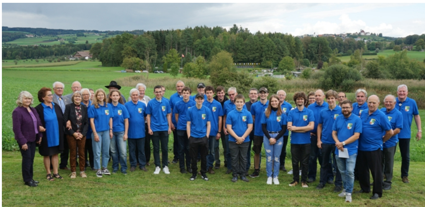
Jubilierende Festgesellschaft des Wehrvereins Hochdorf.